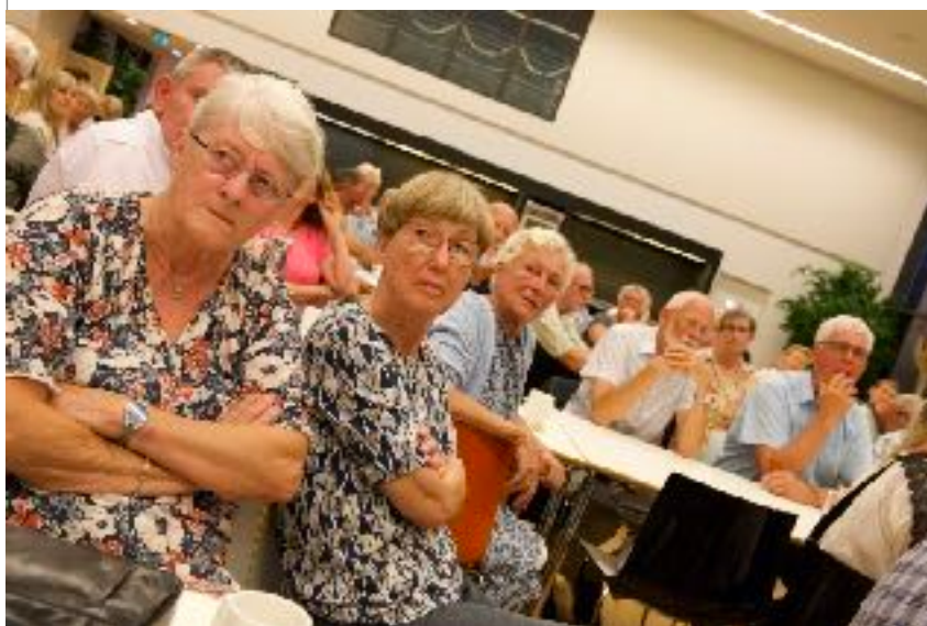
Et kritisk spørgsmål om Venstres forklaring på kravet om besparelser i kommunerne, når der er overskud i statskassen, udløste skeptiske miner.

Venstres formand, Jakob Ellemann-Jensen, er "frisk som en havørn" og retur for fuld kraft. Det forsikrede han Venstres medlemmer på Sjælland i en fyldt sal hos VKST i Sorø. Han udtrykte sin stolthed over et parti, "som ikke stikker med knive, når formanden vender ryggen til," som Ellemann gjorde i et halvt års sygefravær. Han forklarede forskellen mellem Venstre og de nyere nationalkonservative blå partier således: "De nationalkonservative længes efter de gamle dage, som de mener var bedre. Vi har troen på, at i morgen bliver bedre end i dag. Vi længes mere efter i morgen end i går. Derfor er vi gået i regering. De andre blå kan altid stille endnu bedre forslag end vi gør. Men forskellen er, at vores forslag bliver til noget," fastslog han.