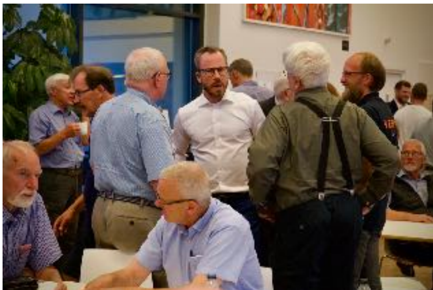
Formanden brugte kaffepausen til snak med medlemmerne

Spørgsmål om en kommende CO 2 -afgift og en ny vandmiljøplan udløste mindre klare svar fra formanden. Regeringen afventer eksperter forslag, men Ellemann-Jensen stillede i udsigt, at planerne ikke må koste arbejdspladser eller blot betyde udflytning af CO 2 -udledning fra Danmark til udlandet. Venstre kan ikke bare sige nej til en CO 2 -afgift, eftersom der er et klart flertal for afgiften i Folketinget. Men Venstre kan påvirke udformningen, så den kommer til at tjene sit formål.