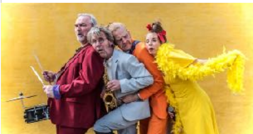
Pressefoto fra Dansk Rakkerpak & FASTER COOLS forestilling Tju-hej Vilde Dyr.