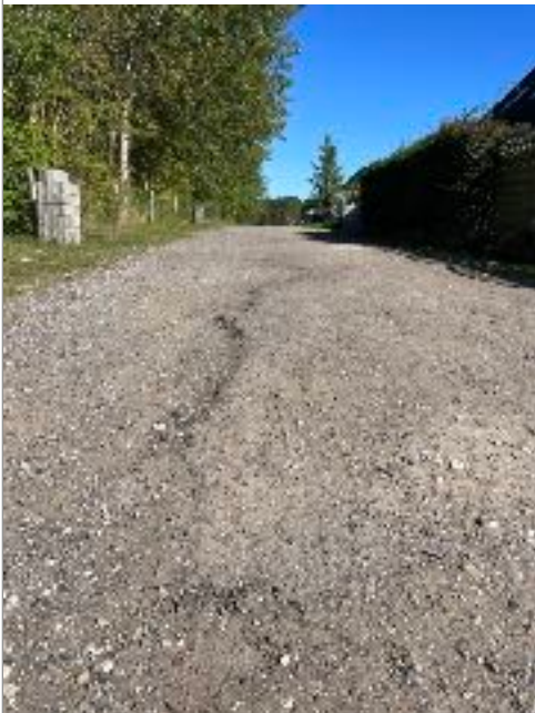
Postrækken øst for Holme-Olstrup er en hyggelig, men ujævn og slidt lille vej.